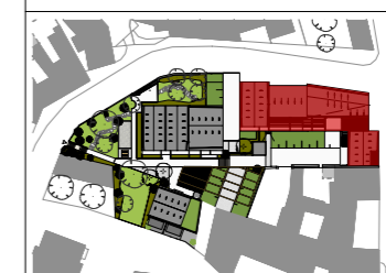
Plan de masse