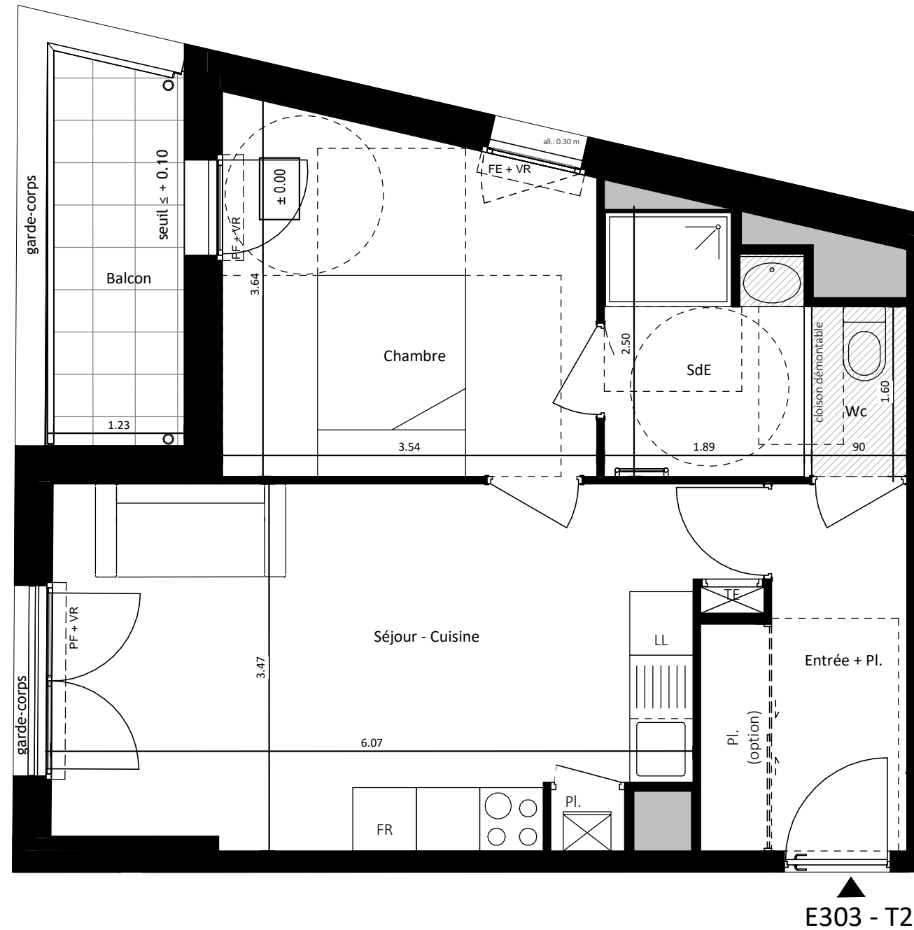
E303 - T2