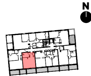
Plan de repérage - bâtiment B - R+1

Plan de commercialisation en date du 13/11/2023 Dossier Notaire