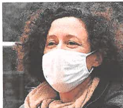
Emmanuelle Wargon, ministre déléguée au Logement.